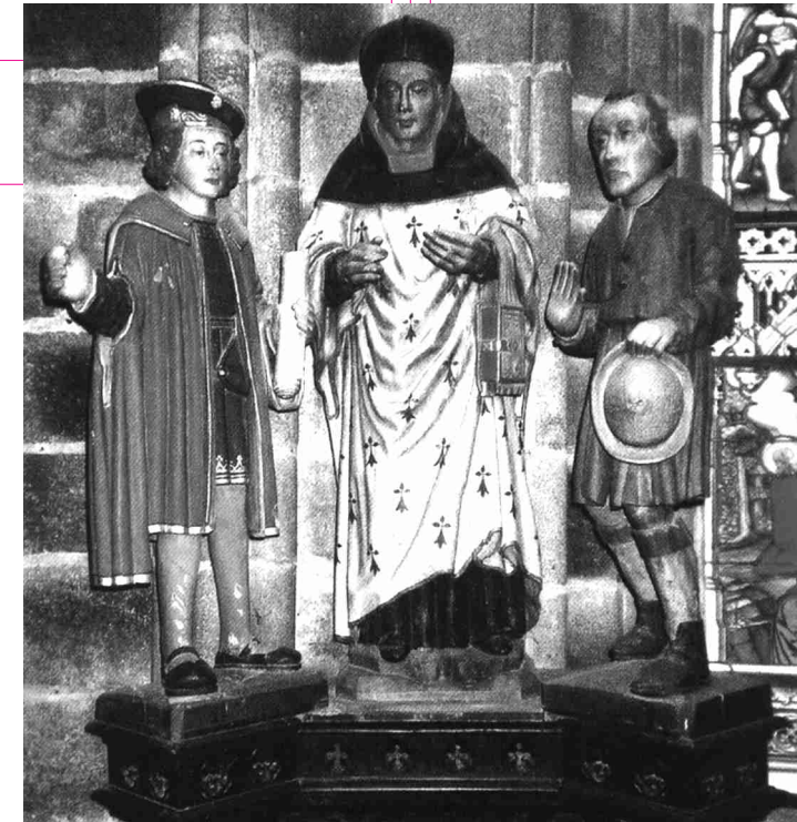
Sant'Ivone fra il ricco ed il povero, Chiesa di Minihy-Tréguier, Francia

Toi, le Patron des avocats et des homme de loi, nous te prions pour ceux qui ont la lourde mission de rendre la justice, e nous te prions aussi pour toutes les victimes de l'injustice sous toutes ses formes. Toi, le Saint Prêtre de Dieu, obtiens à notre Bretagne autrefois si chrétienne les prêtres dont elle a grand besoin. Toi, le modèle de la jeunesse étudiante, aide nos jeunes, en particulier ceux qui sont sans repères, à trouver un sens à leur vie, une raison d'exister. Saint Yves, secours de tous ceux qui t'invoquent, entends notre prière et nous t'en conjurons, sois à l'heure dernière l'avocat des Bretons. Amen.